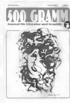
#3 - Februar 2011