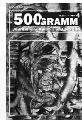
#4 - September 2011