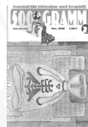
#2 - November 2010