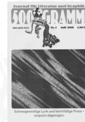
#1 - Juli 2010