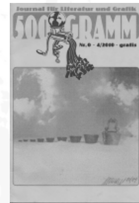
#0 - April 2010